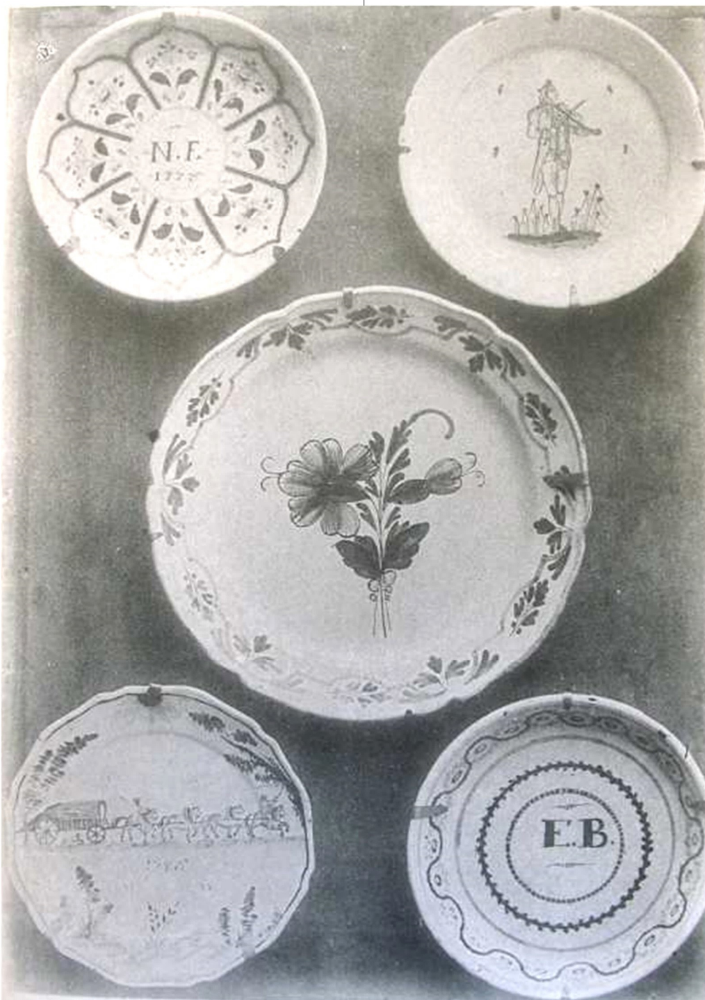
FAIENCES DE MATHAUX

*Hourder : maçonner grossièrement Dictionnaire Français 1851 (Le Landais)